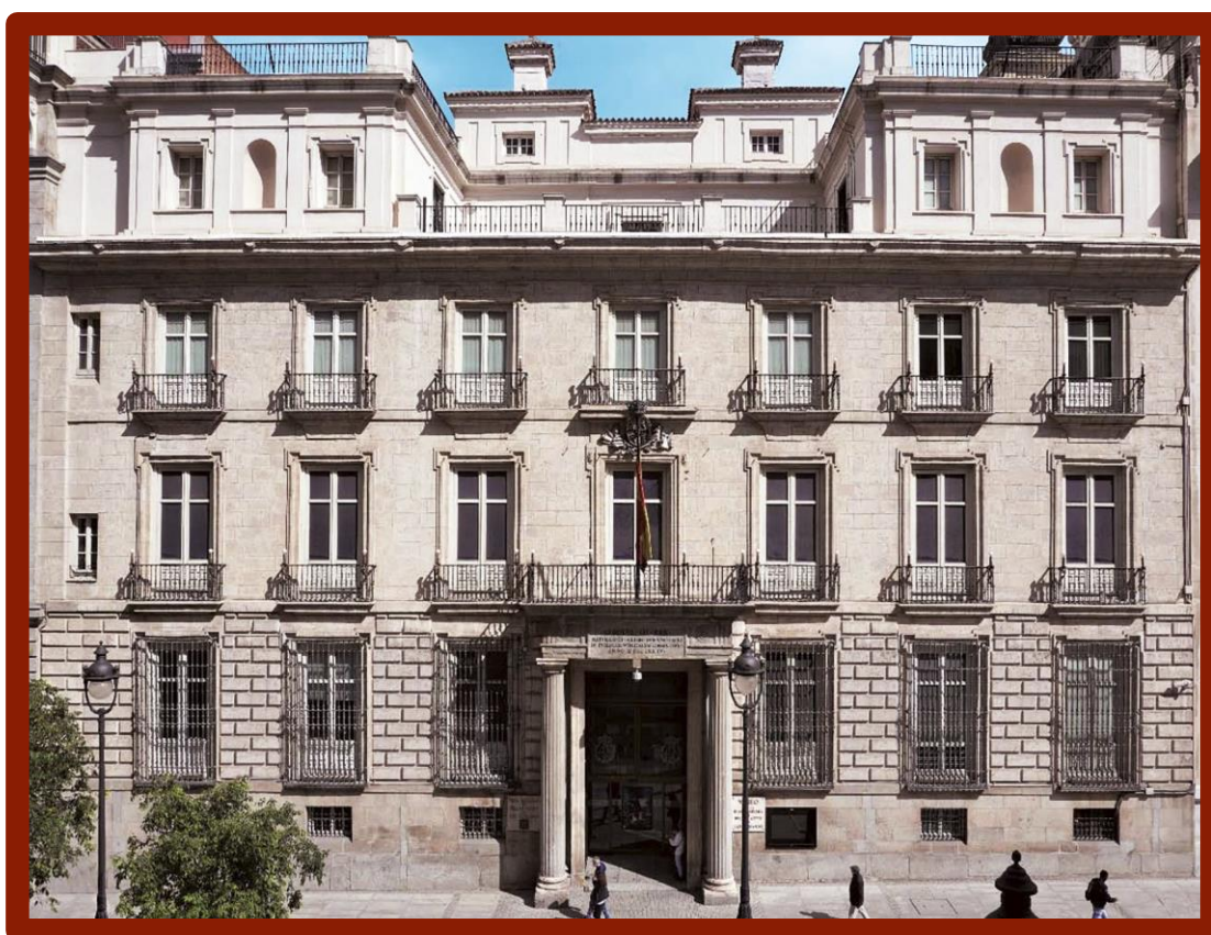
Fachada de la Real Academia de Bellas Artes de San Fernando.